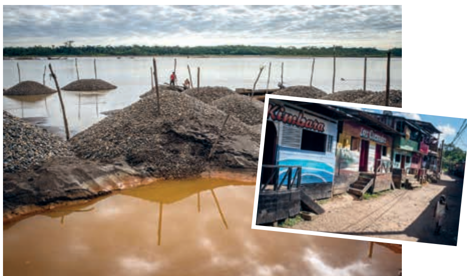
Quelles alternatives pour prévenir la traite des enfants dans les prostibars et l'impact environnemental de l'extraction d'or ?

L'activité aurifère a su créer un véritable microcosme, elle voit fleurir des villages éphémères qui disparaissent en même temps que la disponibilité des ressources naturelles de la forêt. La Pampa, nom de la ville